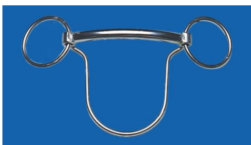
貼顎型防斜跑口銜鐵